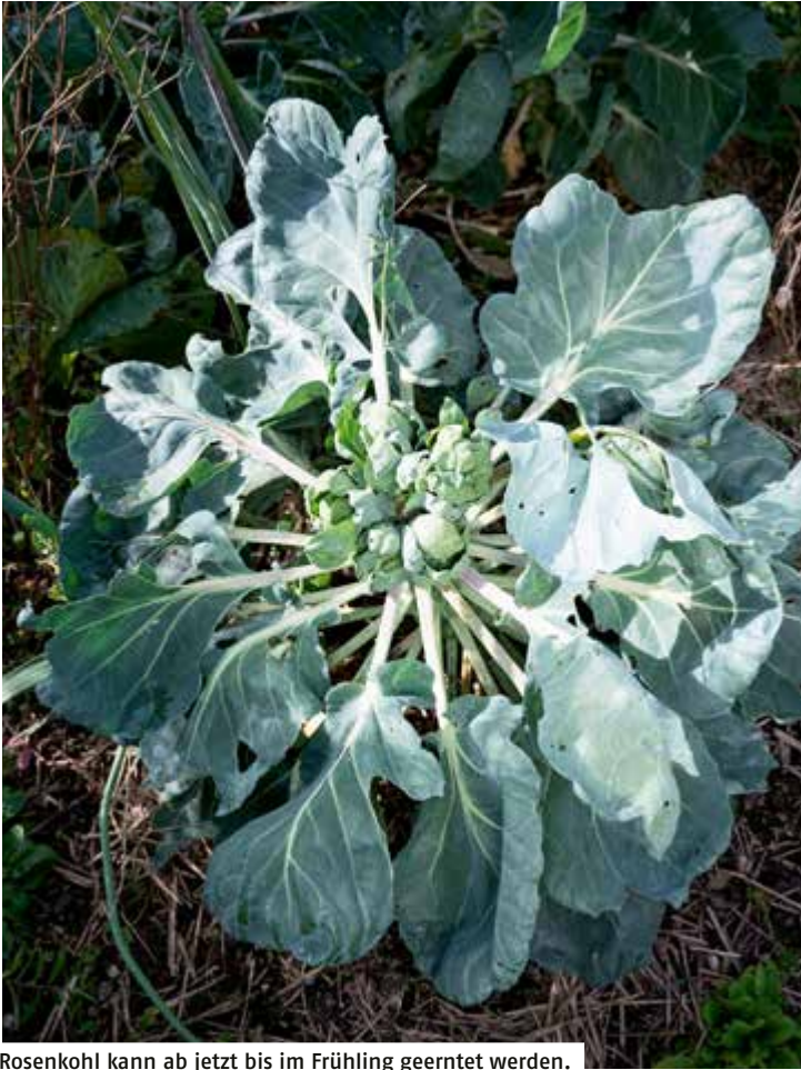
Rosenkohl kann ab jetzt bis im Frühling geerntet werden.