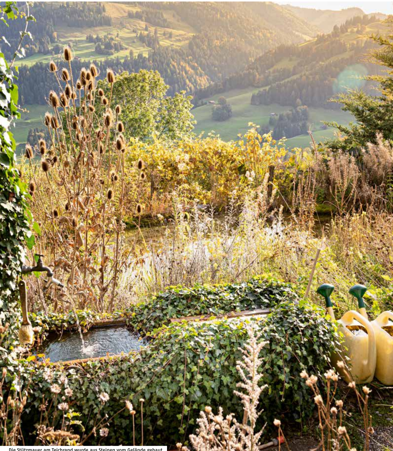
Die Stützmauer am Teichrand wurde aus Steinen vom Gelände gebaut.