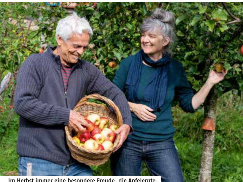
Im Herbst immer eine besondere Freude, die Apfelernte.

Wir sind immer zwischen Schwarz und Weiss, zwischen Unkraut und Heilpflanze.