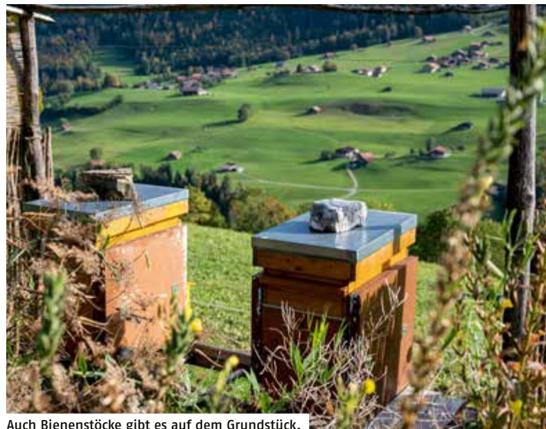
Auch Bienenstöcke gibt es auf dem Grundstück.