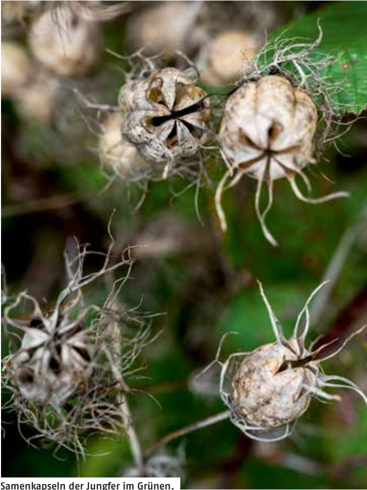
Samenkapeln der Jungfer im Grünen.