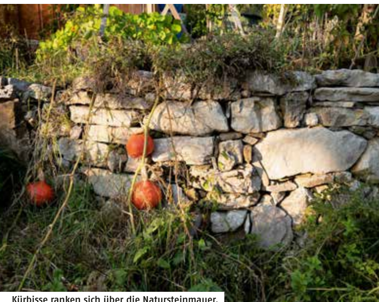
Kürbisse ranken sich über die Natursteinmauer.

Ich bin Leben, das leben will, inmitten von Leben, das leben will.