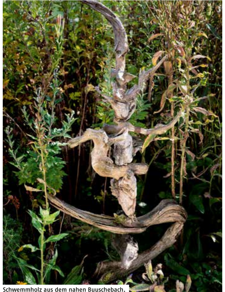
Schwemmholz aus dem nahen Buuschebach.

Wir sind immer zwischen Schwarz und Weiss, zwischen Unkraut und Heilpflanze.