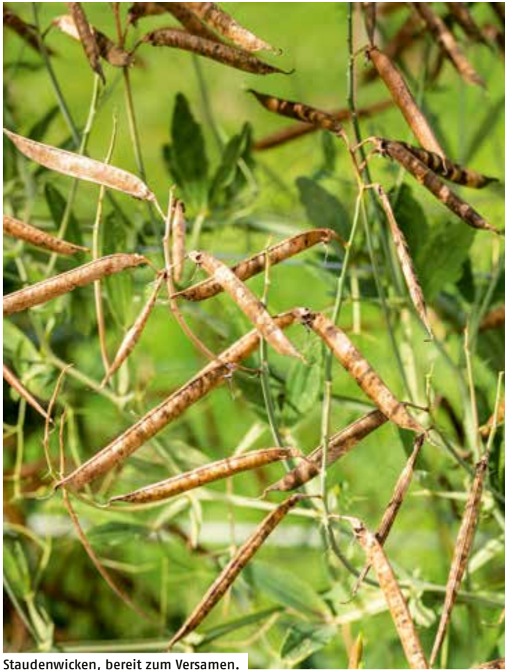
Staudenwickien, bereit zum Versamen.