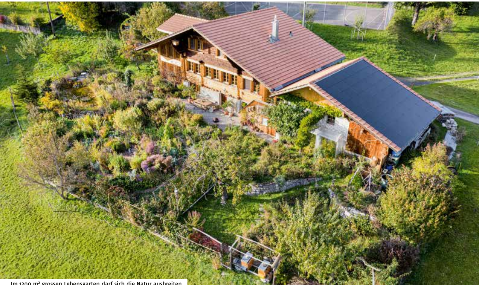
Im 1200 m 2 grossen Lebensgarten darf sich die Natur ausbreiten.

bei ihm, im Takt der Kopfbewegung wippend bei ihr. «Unsere Eheringe», sagen sie.