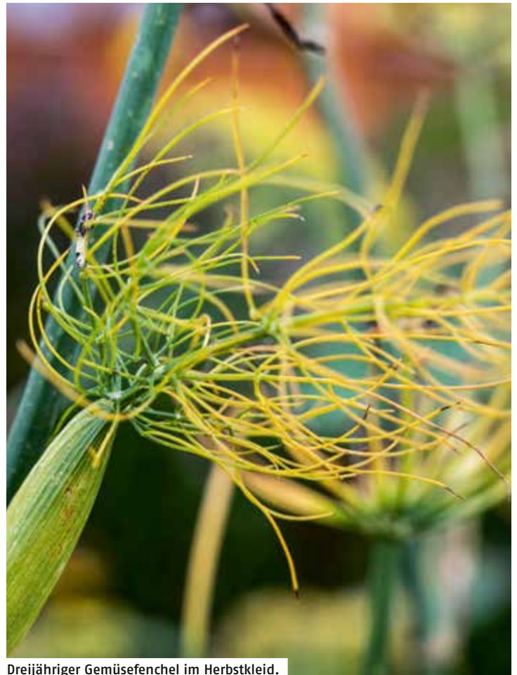
Dreijähriger Gemüsefenchel im Herbstkleid.

Ich bin Leben, das leben will, inmitten von Leben, das leben will.