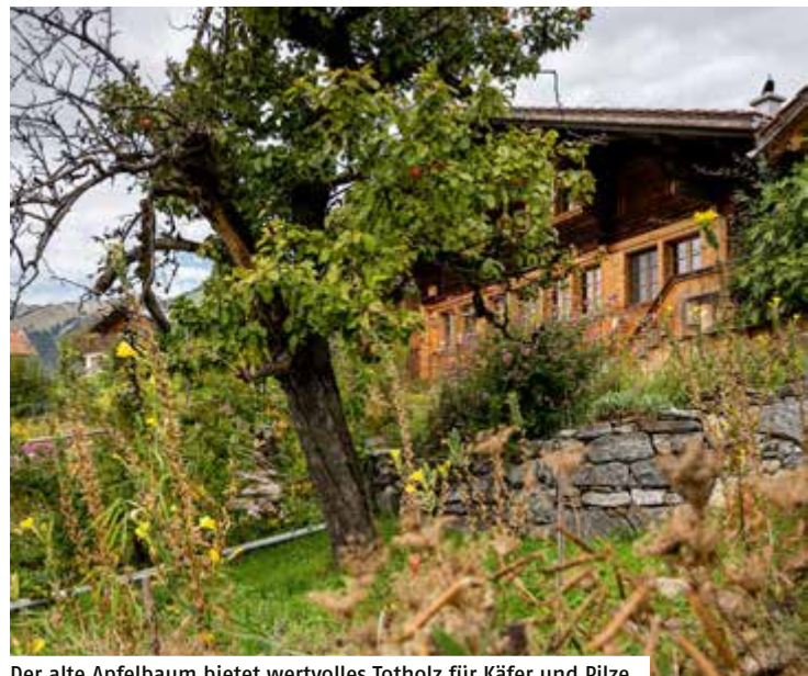
Der alte Apfelbaum bietet wertvolles Totholz für Käfer und Pilze.