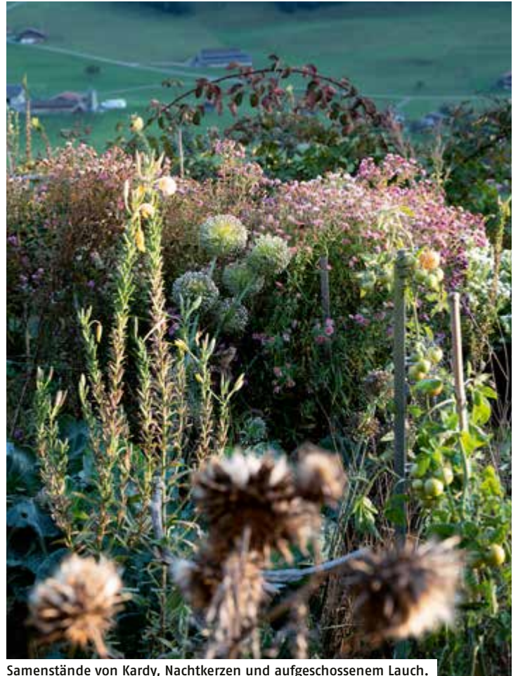
Samenstände von Kardy, Nachtkerzen und aufgeschossenem Lauch.

Wir stehen auf unserer Vergangenheit, auf allem, was je war.